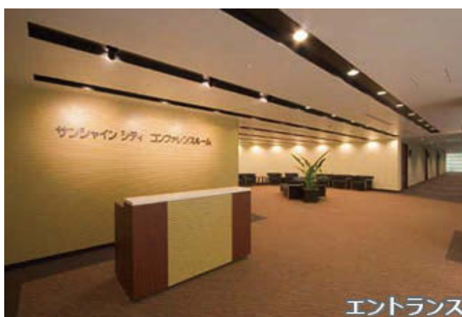
コンファレンスルーム