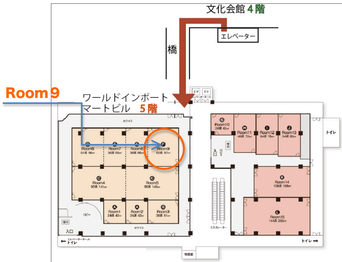
コンファレンスルームへの行き方（平面図）